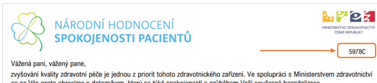
Obrázek 6: Umístění strojově zpracovávaného identifikátoru dotazníku (první strana dotazníku)

Pokud se v nabídce zobrazuje název pracoviště Dětské pediatrie (ID9923) a vím, že mám toto oddělení rozdělené na mladší a starší děti, mohu název ručně upravit na "Dětské oddělení – větší děti" a "Dětské oddělení – menší děti". Současně ale musím označit alespoň jedno z nich písmenným doplněním tak, aby byly kódy pracovišť rozdílné. Výsledkem pak bude např. "Dětské oddělení – větší děti" (ID9923) a "Dětské oddělení – menší děti" (ID9923A).