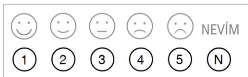
Obrázek 7: Hodnotící škála jednotlivých otázek

V úvodu dotazník obsahuje krátké sdělení, které má pacienta seznámit s účelem hodnocení, způsobu vyplňování dotazníku a případné možnosti opravy. Tento obsah by měl být ve zkrácené verzi též komunikován kompetentním ošetrovatelským personálem při fyzickém předávání dotazníků do rukou pacienta.