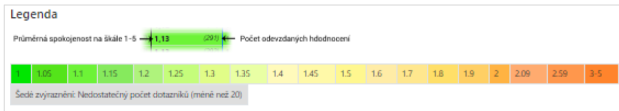
Obrázek 10: Legenda k barevnému podbarvení výstupů z dotazníkového šetření

Procentuální návratnost dotazníků je důležitým metodickým ukazatelem reprezentativnosti souboru odpovídajících pacientů a kvality získaných dat. Aby byly výsledky spolehlivé, měla by procentuální návratnost dotazníků činit alespoň 60 % pro každé pracoviště. Jako metodické minimum byla stanovena 50% návratnost. Pokud poskytovatel zdravotních služeb nedosáhne hranice 50% návratnosti, je výsledek považován za nespolehlivý, nicméně je v rámci projektu vyhodnotitelný. Informace o procentuální návratnosti je důležitou součástí vyhodnocení a poskytovatel by se měl snažit o co možná nejvyšší procentuální návratnost, která přináší spolehlivější výsledky.